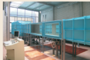
TJ-4边界层风洞(TJ-4 Wind Tunnel)