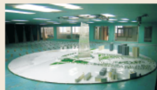
TJ-3边界层风洞(TJ-3 Wind Tunnel)