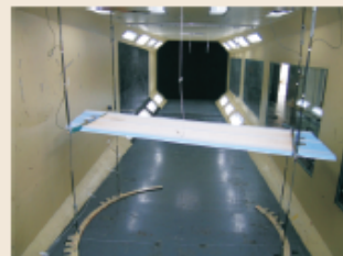
TJ-2风洞(TJ-2 Wind Tunnel)