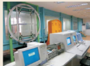
TJ-1风洞(TJ-1 Wind Tunnel)