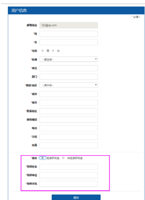
图四 新注册用户信息填写