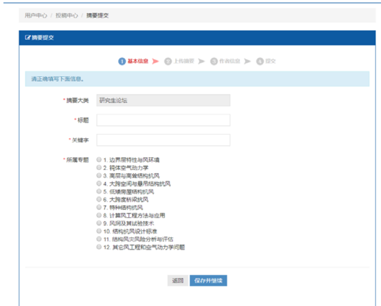
图七 “摘要信息”界面