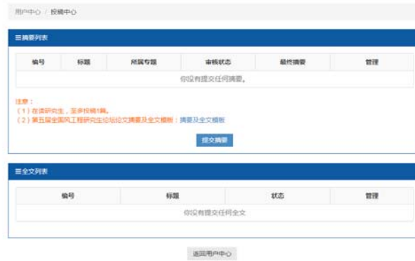
图六 投稿中心界面

(4) 摘要投稿：点击“投稿中心”按钮，进入投稿中心页面，下载相应的会议或论坛模板进行投稿。如图六、图七、图八、图九。