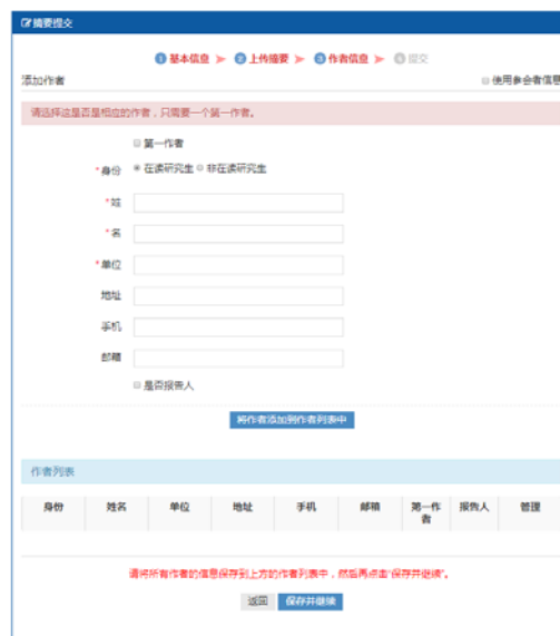
图九 “作者信息”界面