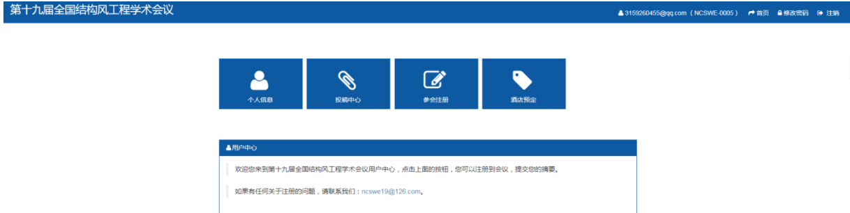
图五 “用户中心”界面

(3) 完成个人信息填写后进入“用户中心”界面，可以进行摘要、全文提交（点击“投稿中心”），会议正式注册等步骤。如图五。