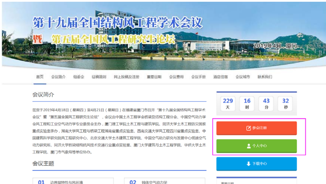
图一 会议网站主页

(1) 作者注册：访问会议网站主页： http://www.ncswe.org/ ，在右下侧有“参会注册”和“个人中心”按钮（如图一），点击按钮进入注册页面（如图二）。