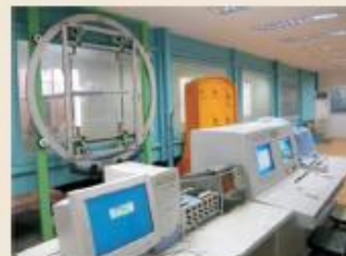
TJ-1风洞(TJ-1 Wind Tunnel)