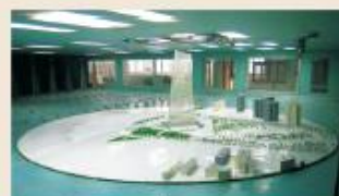
TJ-3边界层风洞(TJ-3 Wind Tunnel)