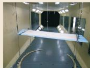
TJ-2风洞(TJ-2 Wind Tunnel)