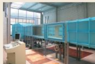
TJ-4边界层风洞(TJ-4 Wind Tunnel)